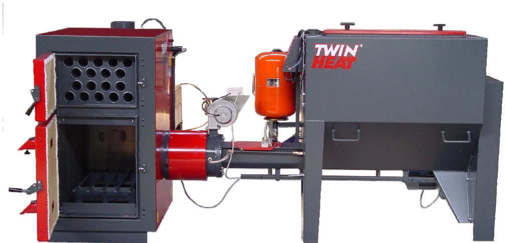
Serie M „compact“